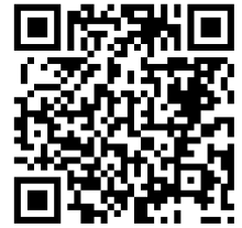
桃園市公立及非營利幼兒園 招生網